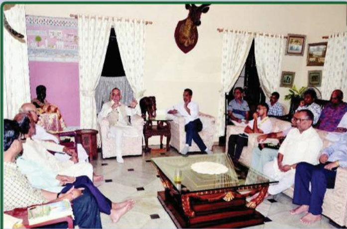
ତା. ୨.୦୯.୧୯ରେ ଶ୍ରୀମନ୍ଦିର ଠାରେ ଗଜପତି ମହାରାଜାଙ୍କ ଅଧିକ୍ଷତାରେ ଆହୂତ 'ଶ୍ରୀଜଗନ୍ନାଥ ତତ୍ତ୍ୱ ଗବେଷଣା, ପ୍ରକାଶନ ଓ ପ୍ରସାର ଉପସମିତି' ବୈଠକ