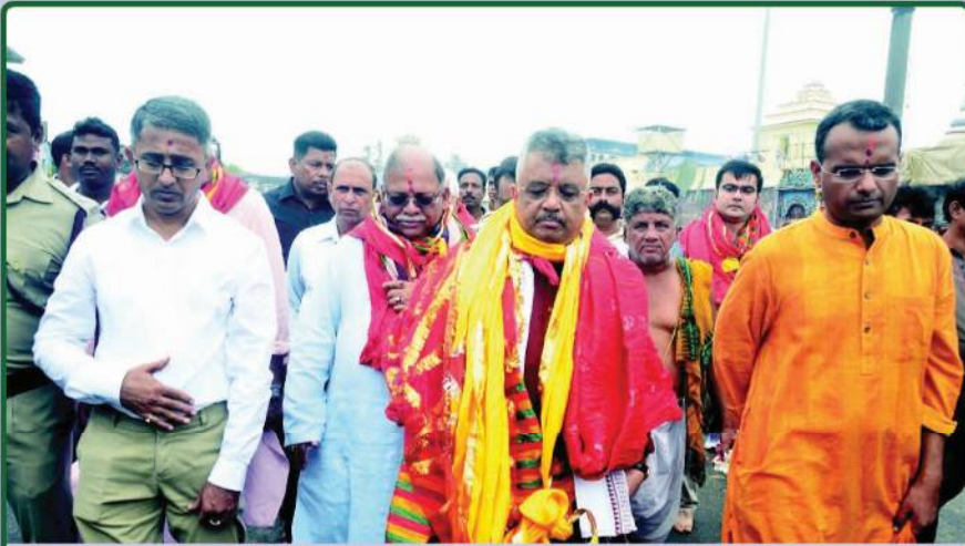
ତା. ୭.୦୯.୧୯ରେ ଶ୍ରୀମନ୍ଦିର ମୁଖ୍ୟ ପ୍ରଶାସକ ଓ ପୁରୀ ଜିଲ୍ଲାପାଳଙ୍କ ଗହଣରେ ଭାରତର ଉଚ୍ଚତମ ନ୍ୟାୟାଳୟର ମାନ୍ୟବର ଆଜିକ୍ୟୁସ୍ କ୍ୟୁରି ଏବଂ ମାନ୍ୟବର ସଲିସିଟର୍ ଜେନେରାଲଙ୍କ ଶ୍ରୀମନ୍ଦିର ପରିଦର୍ଶନ