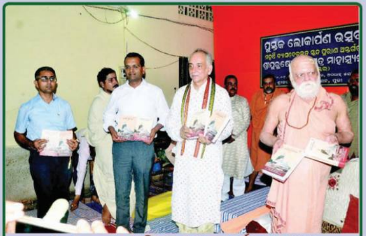
ତା. ୧୦.୦୯.୧୯ରିଖରେ ପୁରୀ ଗୋବର୍ଦ୍ଧନ ପୀଠଠାରେ ଶ୍ରୀମତ୍ ଜଗତଗୁରୁ ଶଙ୍କରାଚାର୍ଯ୍ୟ ମହାରାଜ, ଗଜପତି ମହାରାଜା, ଶ୍ରୀମନ୍ଦିର ମୁଖ୍ୟ ପ୍ରଶାସକ, ଜିଲ୍ଲାପାଳ, ପୁରୀଙ୍କ ଉପସ୍ଥିତିରେ 'ଶ୍ରୀପୁରୁଷୋତ୍ତମ କ୍ଷେତ୍ର ମାହାତ୍ମ୍ୟ'ର ହିନ୍ଦୀ ଅନୁବାଦ ପୁସ୍ତକ ଉଦ୍ଘାଟନ