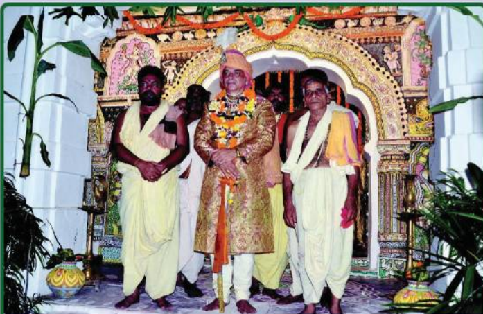
ତା. ୧୦.୦୯.୧୯ରେ ଶ୍ରୀମନ୍ଦିରରେ ଶ୍ରୀଗଜପତି ମହାରାଜାଙ୍କ ସୁନିଆଁ ଉତ୍ସବ ପାଳନ